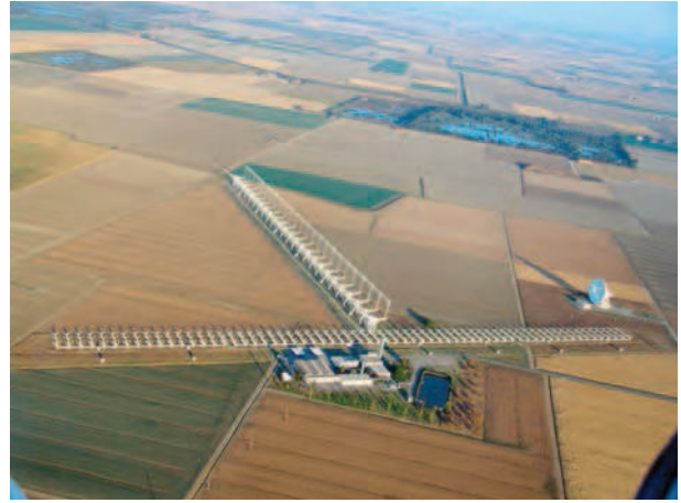
FIG. 2. Stazione Radioastronomica di Medicina - Croce del Nord e parabola VLBI da 32 metri di diametro.

Dopo il “medicoscopio” il mio desiderio era di tornare alla ricerca teorica. Ottenni una borsa di studio annuale CNR-NATO e Jan Oort, direttore dello Sterrewacht di Leiden e icona dell’astronomia olandese e mondiale, si disse disponibile ad ospitarmi. Lo Sterrewacht era un centro all’avanguardia per la ricerca astronomica e, in particolare, per gli studi di radioastronomia galattica con la riga a 21cm dell’idrogeno neutro. Era anche il centro leader di un progetto di un grande radiotelescopio, il Benelux Cross, la cui storia si concretizzò poi nel ben noto Westerbork Radiotelescopio, ma c’era anche un