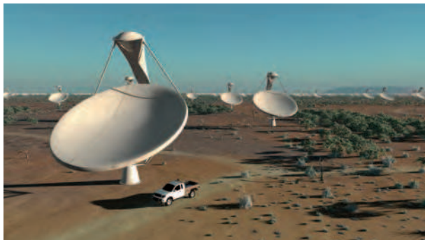
FIG. 4. Il progetto di radioastronomia SKA (Square Kilometre Array).